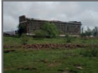
Gelukkig geen persoonlijk letsel na windhoos

We hebben weer een paar enerverende maanden achter de rug... De regentijd kwam laat en toen die uiteindelijk begon, ging dat met een hoop wind gepaard. Op een gegeven moment is er een gigantische windhoos door Grace Village gegaan die onder andere het dak van ons kantoor, een gedeelte van het dak van de school en het hele magazijn meenam... Alles bij elkaar een schadepost van ongeveer 10.000 euro.