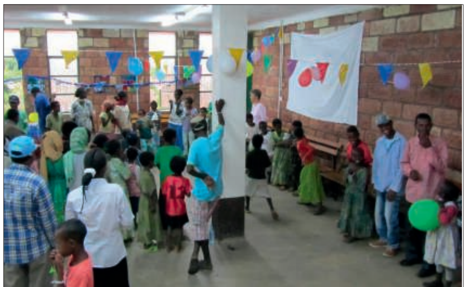
Het was een bijzonder gezellige drukte in onze versierde zaal! Spelletjes, overhandiging van cadeautjes, genieten van traktaties... Een jaarlijks hoogtepunt voor alle kinderen en medewerkers!

We hebben een "eind"evaluatie van de overheid gehad. Dit gebeurt elke drie jaar, waarna wij als organisatie onze registratie mogen vernieuwen. Onder andere de lokale en regionale overheid kwamen langs om te zien wat wij de afgelopen jaren hebben gedaan. Dit wordt vergeleken met het voorstel dat we voorafgaand aan die drie jaar hadden ingediend. Iedereen was zeer tevreden over wat er de afgelopen drie jaar allemaal is gedaan, dus we kunnen in januari weer met een gerust hart herregistreren.