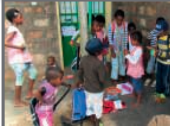
Natuurlijk werden op Grace Village dag alle cadeautjes uitgebreid bewonderd.