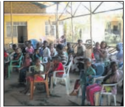
Tijdens het feestje in Shire genoot iedereen van het samenzijn op het terras. Op de grond liggen takken ter versiering om de feestvreugde te vergroten.

We hebben momenteel 1100 kinderen onder onze hoede en het aantal blijft stijgen. Na veel wikken en wegen zijn we uiteindelijk, samen met ons lokale bestuur, tot de conclusie gekomen dat het voor ons beter is om dit project niet voort te zetten. Het project werd een bedreiging voor de