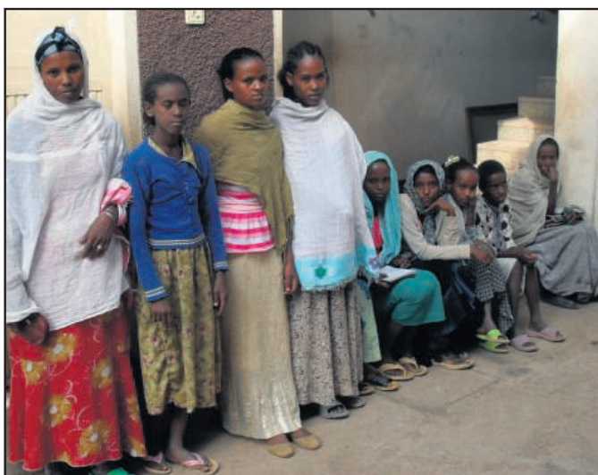
Volwassenen met kinderen van het platteland die gesponsord worden voor hun onderhoud.

De overige kinderen doen allemaal goed hun best en iedereen gaat met plezier naar school. Ook de jongens op de middelbare school doen het goed, ze werken nu halve dagen mee op het kantoor en vinden dat prachtig, want dan kunnen ze gelijk leren met de computer om te gaan.